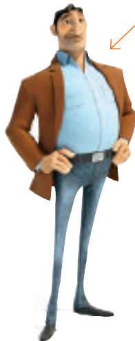
Moreno, el personaje de Esparza en Ferdinand .

QUEM ASSISTE LAW & ORDER NA TV conhece Rafael Barba, o promotor do distrito vivido pelo ator cubano-americano Raúl Esparza.